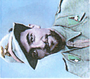
BEATO TERESIO OLIVELLI MED. D'ORO