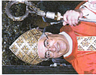
S.E. Lucio Soravito De Franceschi

Verranno altresì COMMEMORATE le seguenti persone a cui era dedicata la Traversata 2020, non conclusa a causa del Covid,