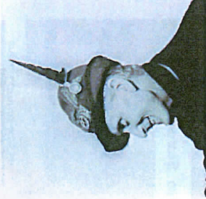
BEATO DON CARLO GNOCCHI