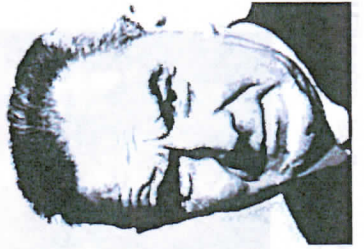
BEATO ALPINO FRATEL LUIGIBORDINO