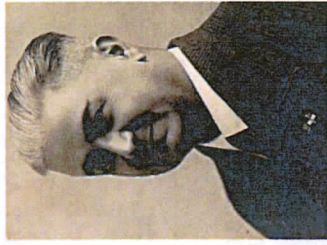
Gen. Camillo Rosso