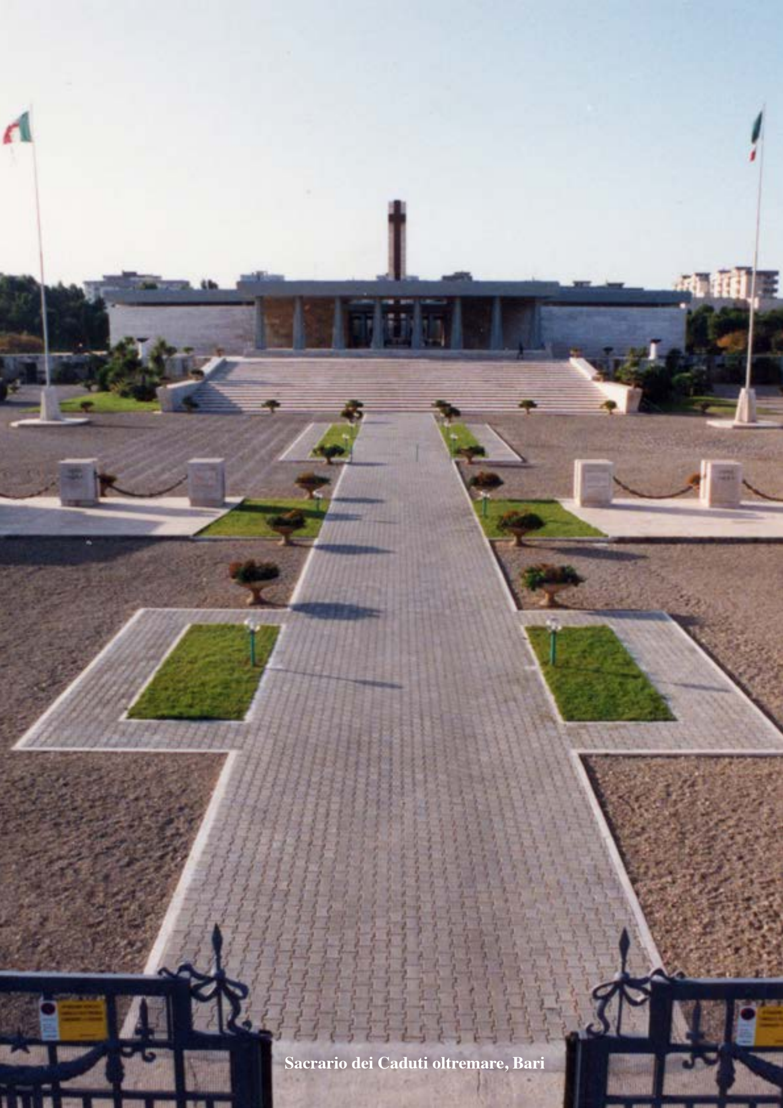
Sacrario dei Caduti oltremare, Bari