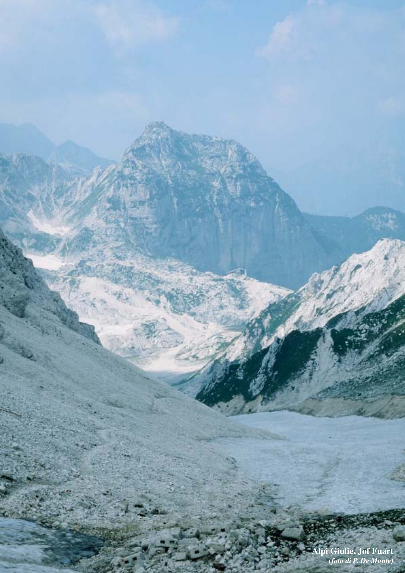
Alpi Giulie, Jof Fuart